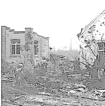
Hauptstraße, Wohnhaus Enning mit Lagerhalle