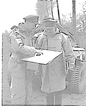
Lagebesprechung britischer Offiziere vor dem Einmarsch.