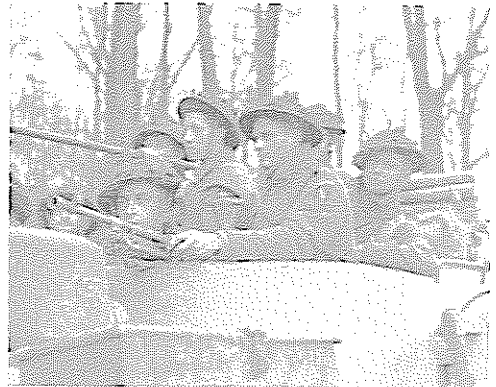
Britische Infantristen des 9. Bataillons der Durham Light Infantry vor ihrem Einsatz in Weseke.