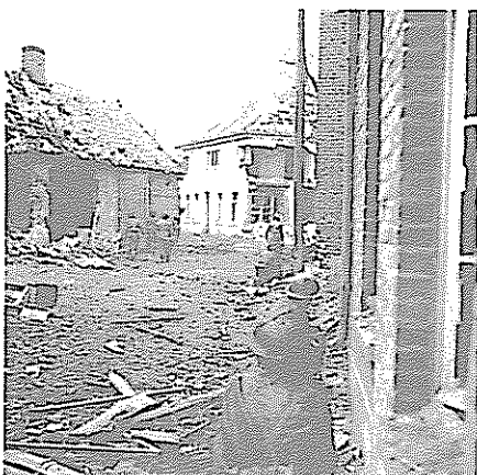
Bahnhofstraße, links Scheune von Enning, rechts jetzt Druckerei Lünenborg, im Hintergrund Haus Abbing