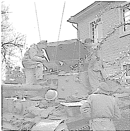
Hauptstraße, Kommandoleitstand vor dem Hause Klöcker