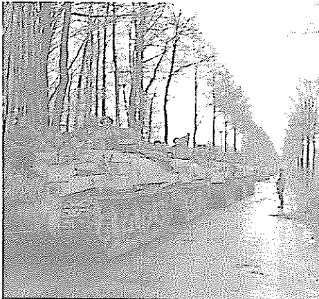
Aufmarsch britischer Panzer auf der B 70 hinter dem Sternbusch.

Einmarsch alliierter Truppen in Weseke, am 30. März 1945 und Luftaufnahmen des vorbereitenden Bombenangriffs vom 22. März 1945