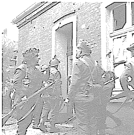
Hausdurchsuchung, Hauptstraße, Haus Dunker