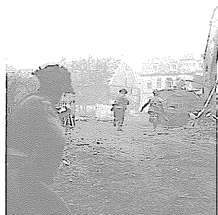
Lindenbuschring, im Hintergrund Fa. Hemming